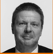
NATIONALRAT MARTIN BÄUMLE Finanzvorstand, Stadt Dübendorf

Nach seinem Chemie-Studium an der ETH arbeitete Martin Bäumle als Atmosphärenwissenschaftler im Bereich Luftschadstoff-Messungen und -Analysen. Als Nationalrat ist er Mitglied der Kommission für Umwelt, Raumplanung und Energie.